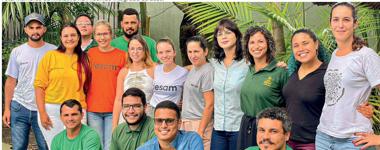
Foto: Membros da Iniciativa na I Reunião Integrada de 2023.

Nossa Iniciativa foi divulgada em rede nacional no programa Profissão Repórter, da TV Globo. Perdeu? Assista no Globoplay!